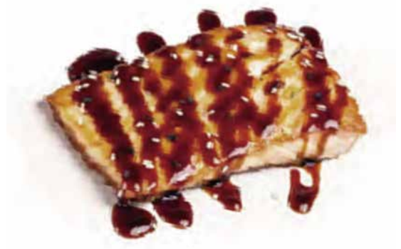
255.SALMONE ALLA PIASTRA € 10.00 (MAX 1)