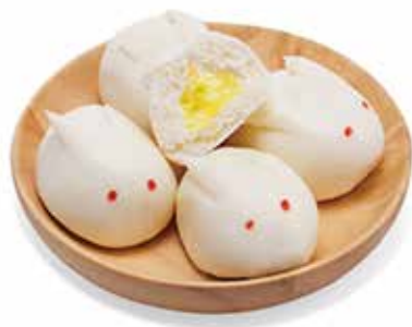
34. PANE CREMA € 3.50 (pane cinese dolci)