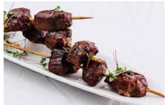
253.SPIEDINI DI MANZO € 7.00