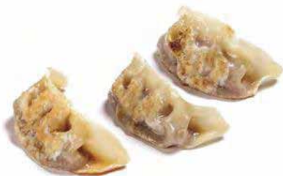
32. YAKI GYOZA € 5.00 (ravioli di polio)