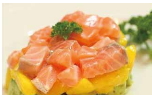
46. SAKE MANGO € 8.00 (salmone, mango, salsa mango) (MAX 1)