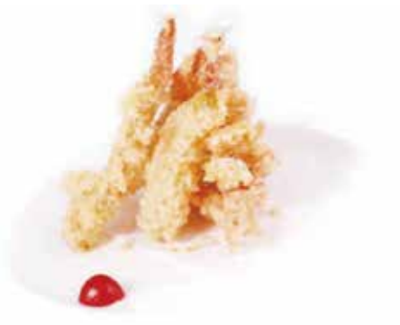
212.TEMPURA MISTO € 9.00 (gamberi* e verdure in tempura)