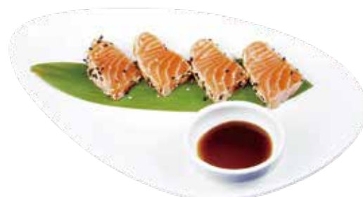
50. SALMON TATAKI € 9.00 (fette di salmone scottato, sesamo, salsa teriyaki) (MAX 1)