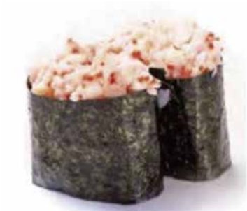
112.GUNKAN EBI € 3.00 (tartar gambero cotto)