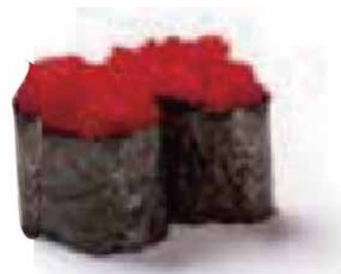
113.GUNKAN TOBIKO € 3.00 (uova di pesce volante)