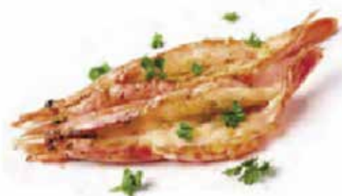
254.GAMBERONI ALLA PIASTRA € 9.00 (MAX 1)