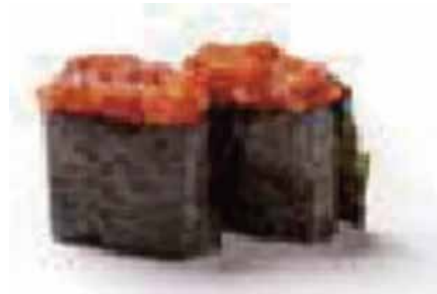
111.GUNKAN SPICY TUNA € 3.50 (tartar tonno)