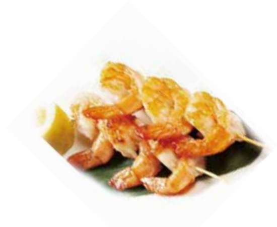
251.SPIEDINI DI GAMBERI ALLA PIASTRA € 7.00