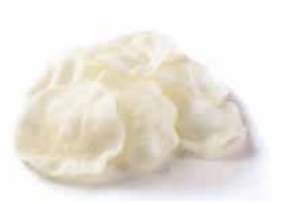
21.NUVOLE DI GAMBERI € 2.00