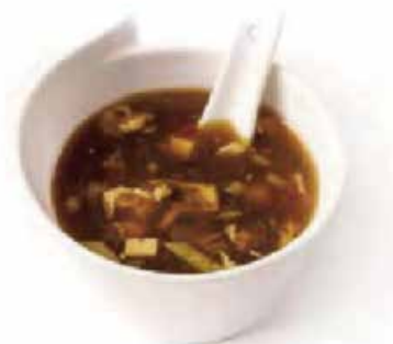
15.ZUPPA MISOSHIRO € 3.00 (zuppa di soia con tofu e alghe)