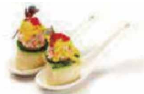
119.GUNKAN ZUCCHINE EBI € 3.50 (tartar gambero con zucchini esterna e salsa zafferano) (MAX 2)