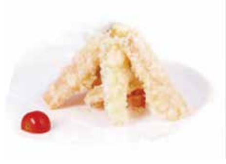
211.YASAI TEMPURA € 7.00 (verdure in tempura)