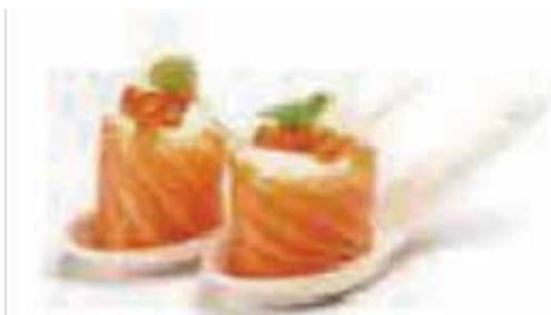
115.GUNKAN SALMON PHILADELPHIA € 3.50 (salmone esterno con dentro philadelphia) (MAX 2)