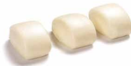
33. PANE CINESE € 2.50 (pane cinese al vapore)