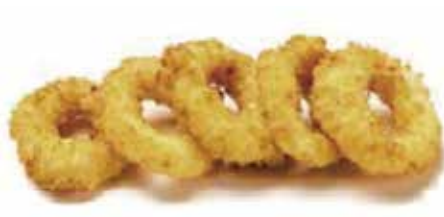
214.CALAMARI FRITTI € 7.00 (anelli di calamari* impanato)