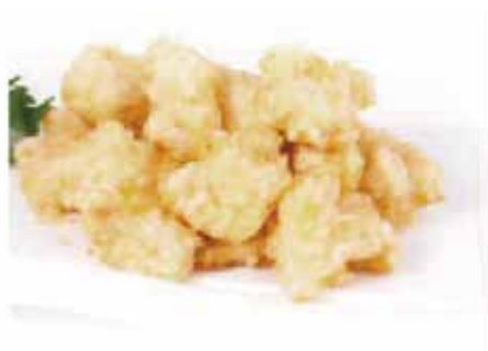
18.KROKKE € 5.00 (crocchette di pollo)