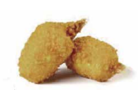
22.CHELE DI GRANCHIO* € 4.50