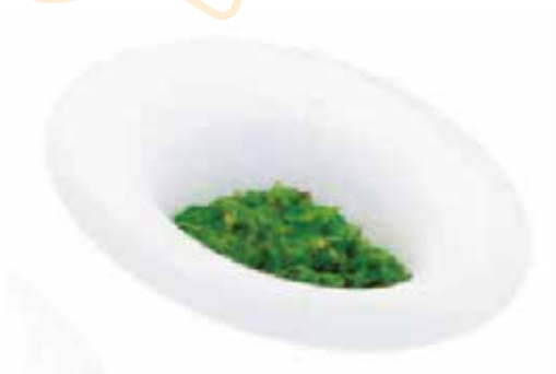
10.GOMA WAKAME € 6.00 (alghe piccantino con sesamo)