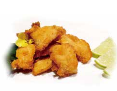
213.POLLO FRITTO € 7.00