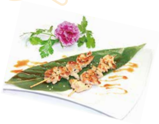
250.SPIEDINI DI POLLO ALLA PIASTRA € 6.00