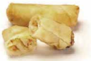
14.HARUMAKI € 6.00 (involtino giapponese con polpa di gamberi* granchio e verdure)