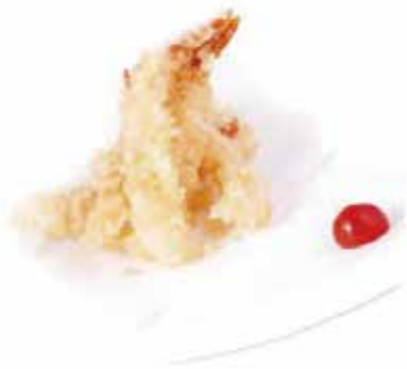
210.EBI TEMPURA € 9.00 (gamberi* in tempura)