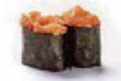
110.GUNKAN SPICY SALMON € 3.00 (tartar salmone)