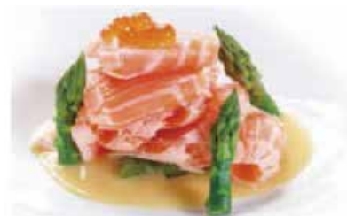
45. SALMON FLAMBE € 9.00 (fette di salmone scottato dalla fiamma salsa di sesamo e pistacchio)