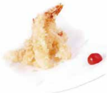
210.EBI TEMPURA € 9.00 (gamberi* in tempura)