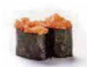
110.GUNKAN SPICY SALMON € 3.00 (tartar salmone)