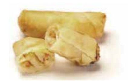
14. HARUMAKI € 6.00 (involtino giapponese con polpa di gamberi* granchio e verdure)