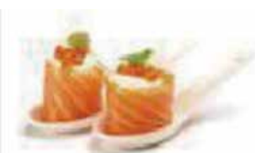
115.GUNKAN SALMON PHILADELPHIA € 3.50 (salmone esterno con dentro philadelphia)