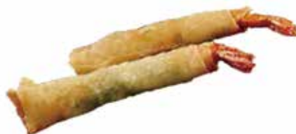
13. SAMURAI STICK € 6.00 (stick di gambero* e edamame)