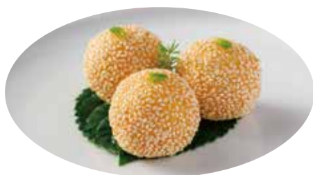
16. MOCI DI RISO FRITTO € 6.00 (farina di riso, glutinoso, burro, sesamo)