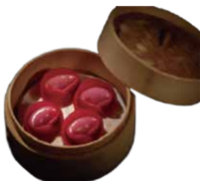
35. DIM SUM MANZO € 6.00 (pasta foglia alla barbabietola con ripieno di manzo)