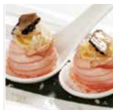
117.GUNKAN SAKE TARTUFO € 5.00 (salmonescottato esterno con dentro philadelphia e sopra scaglie di tartufo e salsa teriyaki)