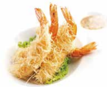
19.EBI KATAIFI € 6.00 (gamberoni* avvolti da pasta kataifi fritti)