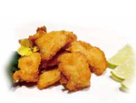
213.POLLO FRITTO € 7.00