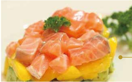
46.SAKE MANGO € 8.00 (salmone, mango, salsa mango)