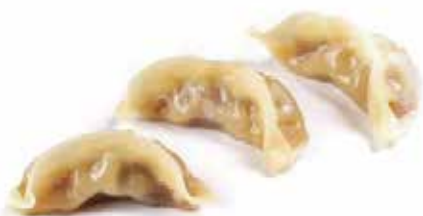
30. GYOZA € 4.00 (ravioli di carne)