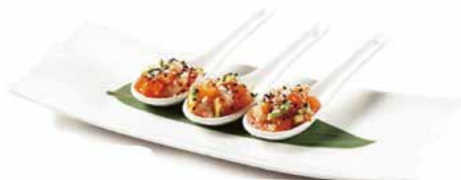
42. TARTAR MIX € 11.00 (misto di pesce, pomodorino, avocado e mango alla salsa passion fruit)