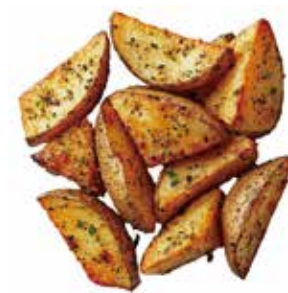
17. PATATE FRITTO € 4.00