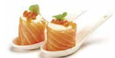
118.GUNKAN SAKE TOBIKO € 3.50 (uova di pesce volante con salmone esterna)