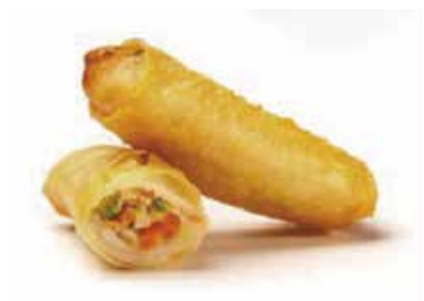
12. INVOLTINO € 2.50 (involtino di verdure)