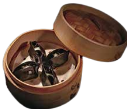
35. DIM SUM CALAMARI € 6.00 (pasta foglia al nero di seppia con ripieno di calamari)