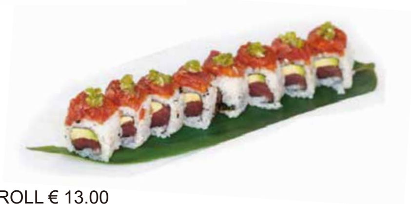
141. DIM TUNA ROLL € 13.00 (avocado, philadelphia, avvolto da tartare di tonno e pistacchio e salsa mango)