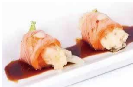
24.SALMON LONGE ROLL € 9.00 (gambero in tempura, Philadelphia, avvolto da salmone scottato e salsa terriyaki)