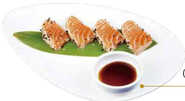
50.SALMON TATAKI € 9.00 (fette di salmone scottato,sesamo,salsa teriyaki)