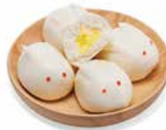
34. PANE CREMA € 3.50 (pane cinese dolci)