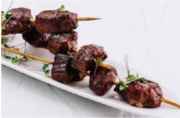
253.SPIEDINI DI MANZO € 7.00