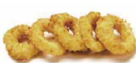
214.CALAMARI FRITTI € 7.00 (anelli di calamari* impanato)