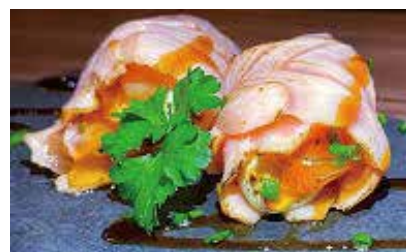
25.SALMON FLOROLL € 9.00 (insalata, Philadelphia, avvolto da salmone scottato e salsa rosa)