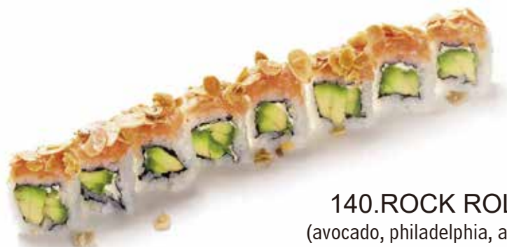
140. ROCK ROLL € 12.00 (avocado, philadelphia, avvolto da tartare di salmone e mandorle)