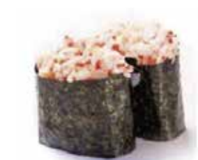
112.GUNKAN EBI € 3.00 (tartar gambero cotto)