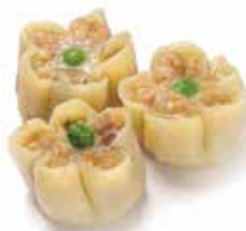
31. EBI GYOZA € 5.00 (ravioli di gamberi)