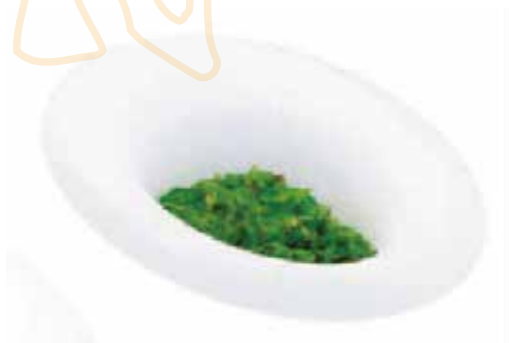
10. GOMA WAKAME € 6.00 (alghe piccantino con sesamo)