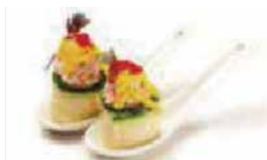
119.GUNKAN ZUCCHINE EBI € 3.50 (tartar gambero con zucchina esterna e salsa zafferano)