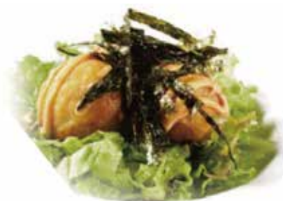
23.TAKOYAKI € 7.00 (polpette di polipo, tonno essiccato, salsa rossa)