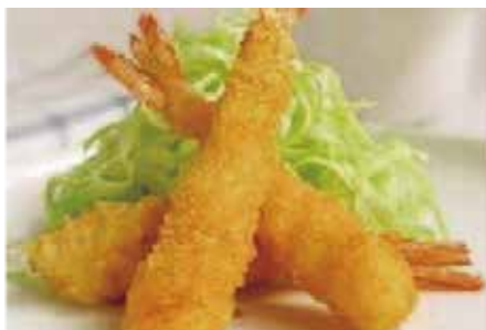
20.EBI FRY € 7.00 (gamberi* impanati con salsa rosa)