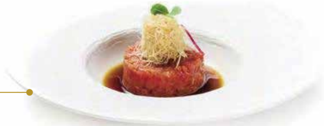
47.TARTAR TONNO € 10.00 (tartar di tonno con la salsa carote mela)