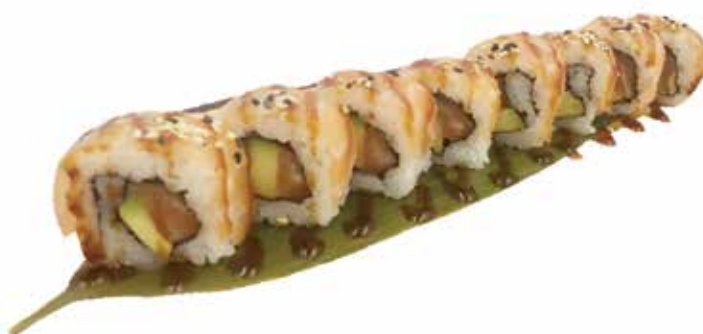
143. SALMON STYLE ROLL € 12.00 (salmone, avocado, avvolto da salmone, salsa teriyaki)