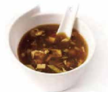
15. ZUPPA MISO SHIRO € 3.00 (zuppa di soia con tofu e alghe)