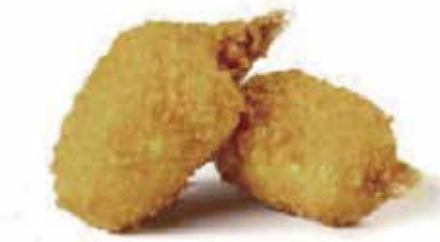
22.CHELE DI GRANCHIO* € 4.50