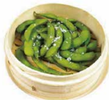
11. EDAMAME € 4.50 (baccelli di soia)