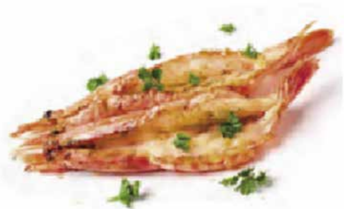
254.GAMBERONI ALLA PIASTRA € 9.00