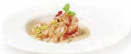
44. SALMON PASTA € 8.00 (stroscione di salmone con salsa di sesamo e mandorle)