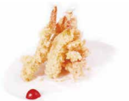
212.TEMPURA MISTO € 9.00 (gamberi* e verdure in tempura)