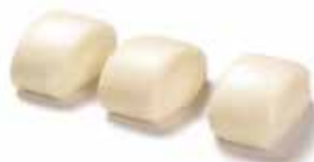
33. PANE CINESE € 2.50 (pane cinese al vapore)