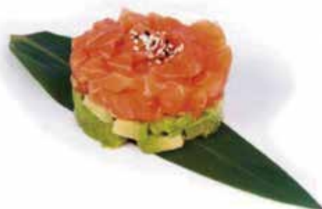
41. TARTAR SALMON CUBÉ € 9.00 (cubetti di salmone, avocado con la salsa ponzu)