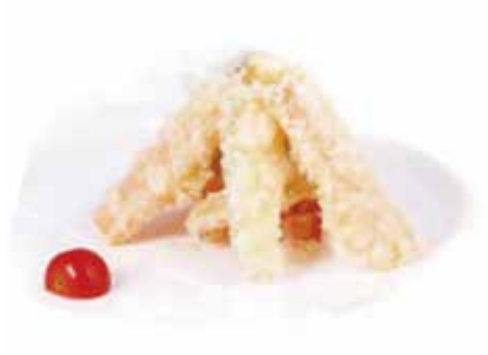
211.YASAI TEMPURA € 7.00 (verdure in tempura)