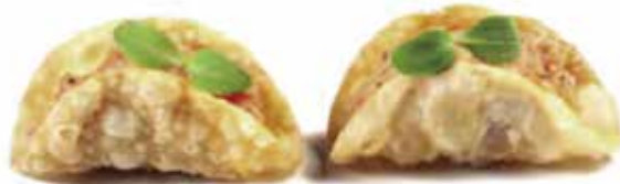
49.TARTUFO TACOS € 8.00 (con tartar salmone, pomodorino, philadelphia e salsa tartufata)