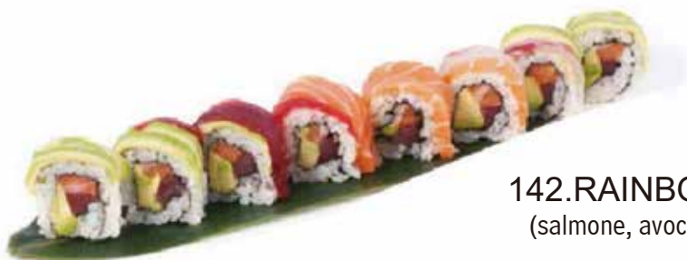
142. RAINBOW SPECIAL € 12.00 (salmone, avocado, avvolto da pesce misto)