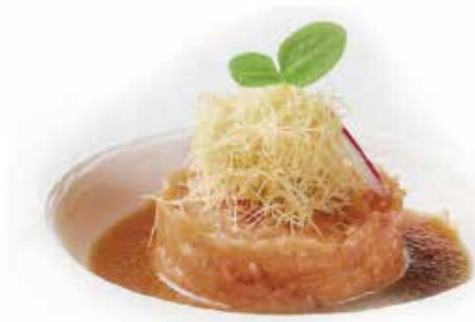
40. TARTAR SALMONE € 8.00 (tartar di salmone con la salsa carote mela)