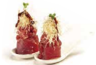
116.GUNKAN TUNA OUT € 4.50 (tartar tonno con tonno esterna)