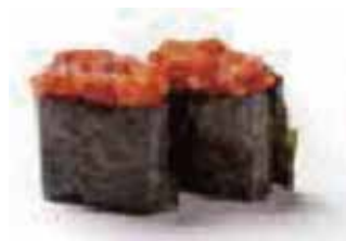
111.GUNKAN SPICY TUNA € 3.50 (tartar tonno)