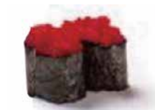
113.GUNKAN TOBIKO € 3.00 (uova di pesce volante)