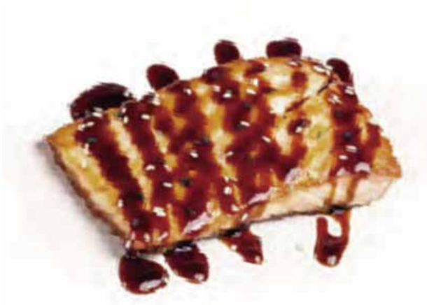
255.SALMONE ALLA PIASTRA € 10.00