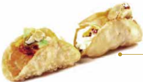
48.SALMON TACOS € 8.00 (con salmone cotto, avocado, philadelphia, mandorle e salsa teriyaki)