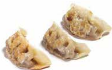
32. YAKI GYOZA € 5.00 (ravioli di polio)