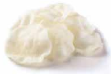
21.NUVOLE DI GAMBERI € 2.00