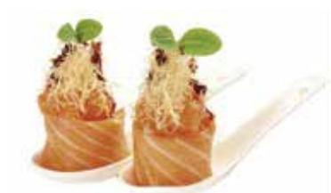
114.GUNKAN SALMON OUT € 3.50 (tartar salmone con salmone esterna)