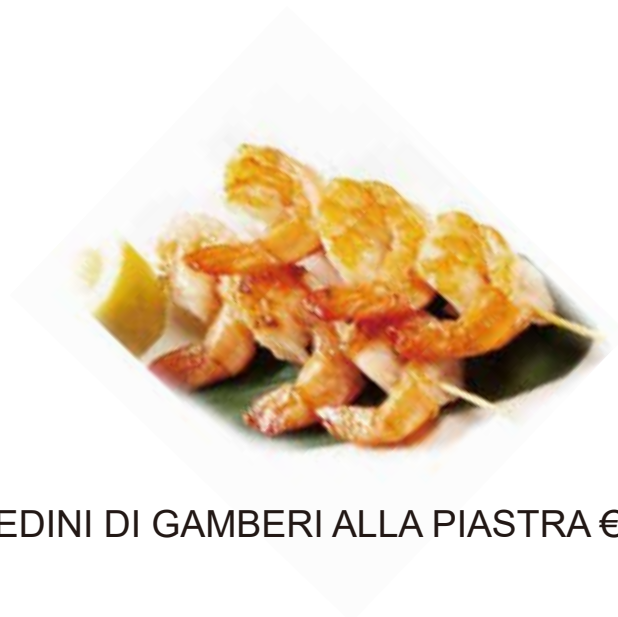
251.SPIEDINI DI GAMBERI ALLA PIASTRA € 7.00