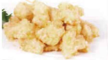
18.KROKKE € 5.00 (crochette di pollo)