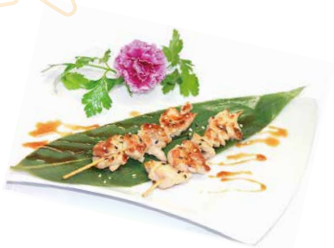
250.SPIEDINI DI POLLO ALLA PIASTRA € 6.00