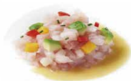
43. TARTAR BRANZINO € 10.00 (Tartar di branzino, pomodorino, avocado e mango alla salsa passion fruit)